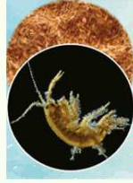
FARINA DI ZAMPE DI GAMMARUS