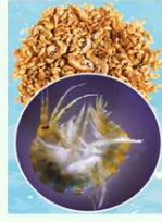
FARINA DI GAMMARUS

La linea di prodotti ORNIBUGS è costituita da insetti e crostacei essiccati al sole e finemente macinati. L'elevato tenore proteico rende questi prodotti particolarmente ideali ad aumentare il livello di proteine nella dieta base di tutte le specie di uccelli. Aggiungere al pastoncino per incrementare il tenore proteico. IMBALLI DISPONIBILI: barattolo da 100 g. - secchiello da 800 g.