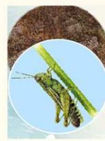
FARINA DI CAVALLETTE