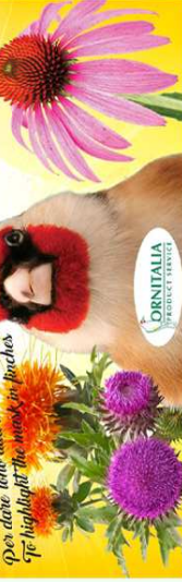
Non deve Tene alla maschera The highlight the mask in patches