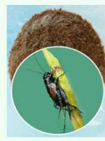
FARINA DI GRILLI