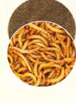
FARINA DI LARVE DELLA FARINA