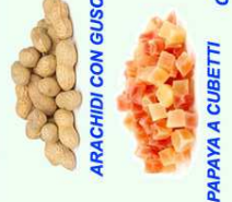
ARACHIDI CON GUSCIO

La frutta secca può rappresentare un diversivo che è molto gradito agli uccelli, in particolare Pappagalli e Frugivori: la presenza di grassi e oligoelementi la rende molto appetibile e gustosa al palato degli animali, inoltre è una fonte genuina di omega 3 e vitamine o di zuccheri semplici.