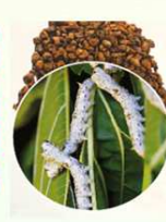
FARINA DI CRISALIDI DI BACCHI DA SETA