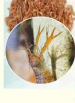
FARINA DI GAMBERI DI FIUME