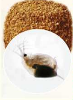
FARINA DI DAPHNIA