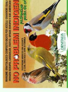
MANGIME ORNITOLOGICO COMPLETO IDEATO PER UCCELLI DI GRANDI DIMENSIONI